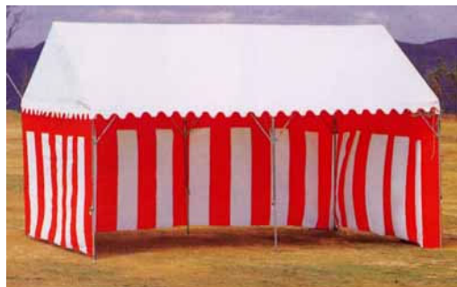
パイプテント (紅白幕)