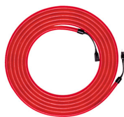
ピカライトチューブ