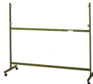
ボード用スタンド