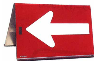
山型矢印板 (公団型)