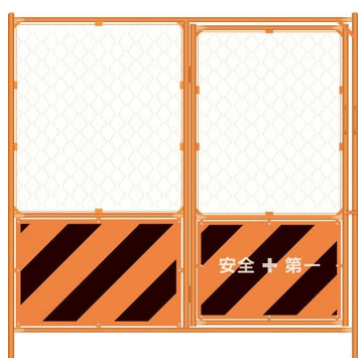
フェンスバリケード (扉付き)