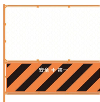
フェンスバリケード